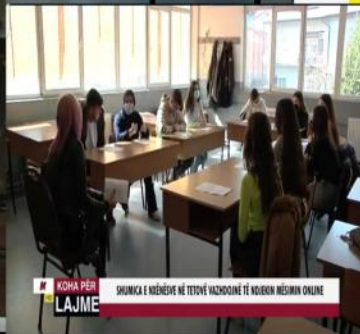
KOHA PËR LAJME SHUMICA E NXËNËSVE NË TETOVË VAZHDOJNË TË NDJEKIN MËSIMIN ONLINE