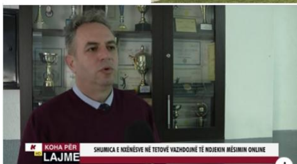
KOHA PËR LAJME SHUMICA E NXËNËSVE NË TETOVË VAZHDOJNË TË NDJEKIN MËSIMIN ONLINE